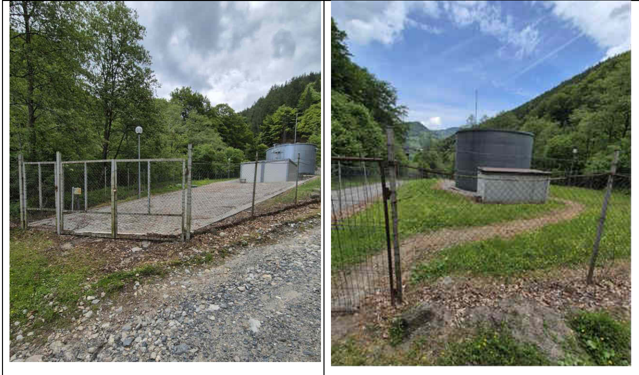
Fig. 1 Imagini privind amplasamentul statiei de tratare existenta.